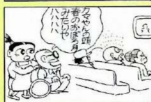
カマヤん 定期健診 ありむら潜

生涯、自分の歯で食べることを目指す「8020運動」は、健康長寿における歯の役割を理解し、歯を大切にするという価値観を持つことが出発点になります。