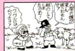
実話である。誰か行こあげて