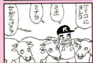
カマヤん 島の若者たち ありむら潜