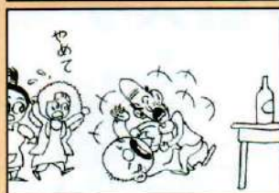
カマヤん 忘却力 ありむら潜

でもご安心ください。歯周病はセルフケアと歯科受診で治療できます。つまり、ほとんどの口臭は抑えることができます。口臭が気になる方はぜひ受診してくださいね。