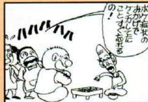
老人力は生きる力である