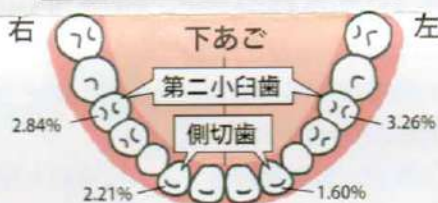
欠如が多い歯の位置と欠如率

小学生以下の子どもは、基本的には経過を観察します。小学生以上になると、歯列矯正などの治療法が考えられます。